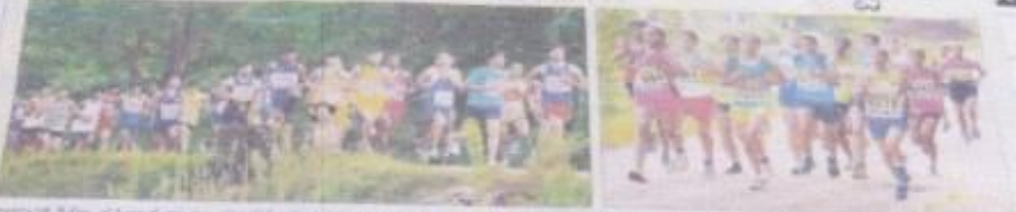
ಆಳ್ವಾಸ್ ಸ್ಟೀಡ್ ಫುಟ್ಬಾಲ್ ಪಾಟು ಮೆಂಟಲ್ ಸ್ಪರ್ಧೆಗಳಲ್ಲಿ ವಿಜಯೋದ್ದಾರವನ್ನು ಪಡೆದ ಆಳ್ವಾಸ್ ಗುಡ್‌ಗಾರು ಓಟ ಸ್ಪರ್ಧೆಯಲ್ಲಿ.

■ ಮೆಂಟಲ್ ಸ್ಪರ್ಧೆ ಮಾಡುವಿದರೆಯಲ್ಲಿ ರಾಷ್ಟ್ರಮಟ್ಟದ ಗುಡ್‌ಗಾರು ಓಟ ಸ್ಪರ್ಧೆ ನಡೆಯಿತು. ಈ ಸಂದರ್ಭದಲ್ಲಿ ಆಳ್ವಾಸ್ ತಂಡದವರು ಅತ್ಯಂತ ಸುಸ್ಥವಾಗಿ ಪಾಟು ಮೆಂಟಲ್ ಸ್ಪರ್ಧೆಯಲ್ಲಿ ವಿಜಯೋದ್ದಾರವನ್ನು ಪಡೆದರು. ಈ ಸಂದರ್ಭದಲ್ಲಿ ಆಳ್ವಾಸ್ ತಂಡದವರು ಅತ್ಯಂತ ಸುಸ್ಥವಾಗಿ ಪಾಟು ಮೆಂಟಲ್ ಸ್ಪರ್ಧೆಯಲ್ಲಿ ವಿಜಯೋದ್ದಾರವನ್ನು ಪಡೆದರು. ಈ ಸಂದರ್ಭದಲ್ಲಿ ಆಳ್ವಾಸ್ ತಂಡದವರು ಅತ್ಯಂತ ಸುಸ್ಥವಾಗಿ ಪಾಟು ಮೆಂಟಲ್ ಸ್ಪರ್ಧೆಯಲ್ಲಿ ವಿಜಯೋದ್ದಾರವನ್ನು ಪಡೆದರು.