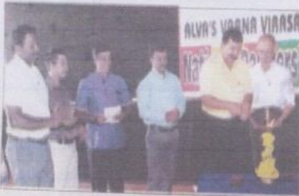
ಕಂಪೌಂಡು ಘಟಕದ ಸಂದರ್ಭದಲ್ಲಿ ಉದ್ಘಾಟನೆ