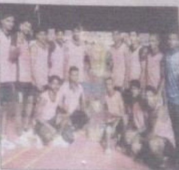
ರಾಜ್ಯಮಟ್ಟದ ಪಂದ್ಯಾಟದಲ್ಲಿ ಪ್ರಶಸ್ತಿ ಗಳಿಸಿ ಸಾಧನೆ ಮಾಡಿದ ಆಲ್ಪ್ಸ್ ತಂಡದ ಸದಸ್ಯರನ್ನು ಪ್ರಶಸ್ತಿ ನೀಡಿ ಸನ್ಮಾನಿಸಲಾಯಿತು.