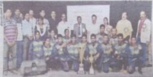
ಮುಖವಾಡದ ವಾ.ಕೆ.ಎಸ್ ಮುಖವಾಡದ ವಾ.ಕೆ.ಎಸ್ ಮುಖವಾಡದ ವಾ.ಕೆ.ಎಸ್ ಮುಖವಾಡದ ವಾ.ಕೆ.ಎಸ್

ಮುಖವಾಡದ ವಾ.ಕೆ.ಎಸ್ ಮುಖವಾಡದ ವಾ.ಕೆ.ಎಸ್ ಮುಖವಾಡದ ವಾ.ಕೆ.ಎಸ್ ಮುಖವಾಡದ ವಾ.ಕೆ.ಎಸ್ ಮುಖವಾಡದ ವಾ.ಕೆ.ಎಸ್ ಮುಖವಾಡದ ವಾ.ಕೆ.ಎಸ್