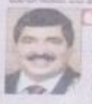
ಆಳ್ವಾಸ್ ತಂಡದ ಕೋಚ್.

■ ಮೆಂಟಲ್ ಸ್ಪರ್ಧೆ ಮಾಡುವಿದರೆಯಲ್ಲಿ ರಾಷ್ಟ್ರಮಟ್ಟದ ಗುಡ್‌ಗಾರು ಓಟ ಸ್ಪರ್ಧೆ ನಡೆಯಿತು. ಈ ಸಂದರ್ಭದಲ್ಲಿ ಆಳ್ವಾಸ್ ತಂಡದವರು ಅತ್ಯಂತ ಸುಸ್ಥವಾಗಿ ಪಾಟು ಮೆಂಟಲ್ ಸ್ಪರ್ಧೆಯಲ್ಲಿ ವಿಜಯೋದ್ದಾರವನ್ನು ಪಡೆದರು. ಈ ಸಂದರ್ಭದಲ್ಲಿ ಆಳ್ವಾಸ್ ತಂಡದವರು ಅತ್ಯಂತ ಸುಸ್ಥವಾಗಿ ಪಾಟು ಮೆಂಟಲ್ ಸ್ಪರ್ಧೆಯಲ್ಲಿ ವಿಜಯೋದ್ದಾರವನ್ನು ಪಡೆದರು. ಈ ಸಂದರ್ಭದಲ್ಲಿ ಆಳ್ವಾಸ್ ತಂಡದವರು ಅತ್ಯಂತ ಸುಸ್ಥವಾಗಿ ಪಾಟು ಮೆಂಟಲ್ ಸ್ಪರ್ಧೆಯಲ್ಲಿ ವಿಜಯೋದ್ದಾರವನ್ನು ಪಡೆದರು.