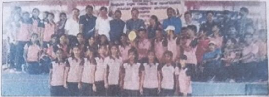
ಜಿಲ್ಲಾ ಮಟ್ಟದ ಆತ್ಮಕ್ಷೇಪ್ ಕ್ರೀಡಾಕೂಟದಲ್ಲಿ ಸಮಗ್ರ ಪ್ರಶಸ್ತಿ ಗೆದ್ದುಕೊಂಡ ಆಲ್ಫಾನ್ ತಂಡ.

ನವದೆ ನೀರಿನ ಆದಕ್ಕೆ ಧನ ಪ್ಯಾಂಕ್ 2,650 ಜಮ ಂತ್ರದಲ್ಲಿ ಂಧ್ಯವೇ