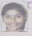
ಆಳ್ವಾಸ್ ತಂಡದ ಆಟಗಾರ್ತಿ.

■ ಮೆಂಟಲ್ ಸ್ಪರ್ಧೆ ಮಾಡುವಿದರೆಯಲ್ಲಿ ರಾಷ್ಟ್ರಮಟ್ಟದ ಗುಡ್‌ಗಾರು ಓಟ ಸ್ಪರ್ಧೆ ನಡೆಯಿತು. ಈ ಸಂದರ್ಭದಲ್ಲಿ ಆಳ್ವಾಸ್ ತಂಡದವರು ಅತ್ಯಂತ ಸುಸ್ಥವಾಗಿ ಪಾಟು ಮೆಂಟಲ್ ಸ್ಪರ್ಧೆಯಲ್ಲಿ ವಿಜಯೋದ್ದಾರವನ್ನು ಪಡೆದರು.