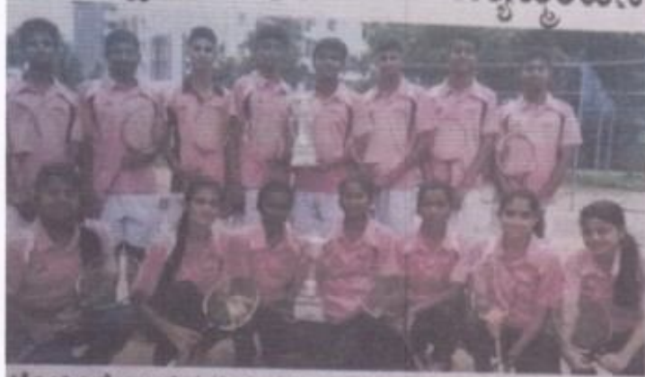
ಕ್ರೀಡಾಂಗಣದ ಆಲ್ಟಾಸ್ ಪದವಿ ಪೂರ್ವ ಕಾಲೇಜಿನ ಬಾಲಕ-ಬಾಲಕಿಯರು.

ಮಂಡಲದಿಂದ ಸೆ. 27 ರೊಳಗಿನ ಗ್ರಾಮೀಣ ಪದವಿ ಪೂರ್ವ ಕಾಲೇಜಿನ ಬಾಲಕ-ಬಾಲಕಿಯರ ಮಧ್ಯೆ ನಡೆಸಿದ ಪದವಿ ಪೂರ್ವ ಕಾಲೇಜಿನ ಬಾಲ್ ಬ್ಯಾಡ್ಮಿಂಟನ್ ಪಂದ್ಯಾವಳಿಯಲ್ಲಿ ಪದವಿ ಪೂರ್ವ ಪ್ರತಿನಿಧಿಯಾದ ಮಂಡಲದಿಂದ ಆಲ್ಟಾಸ್ ತಂಡ ಅವಳಿ ಪ್ರಶಸ್ತಿ ಗೆದ್ದುಕೊಂಡಿದೆ. ಆಲ್ಟಾಸ್ 11ನೇ ಬಾರಿ ಈ ಪ್ರಶಸ್ತಿ ಗೆದ್ದಿದೆ. ಬಾಲಕರ ವ್ಯಕ್ತಿತ್ವ ಪೋಷಣೆಯಲ್ಲಿ ಪದವಿ ಪೂರ್ವ ಪ್ರತಿನಿಧಿಯಾದ ಆಲ್ಟಾಸ್ ಪದವಿ ಪೂರ್ವ ಕಾಲೇಜಿನ ತಂಡವು ಬಾಲಕರ ಪದವಿ ಪೂರ್ವ ಪ್ರತಿನಿಧಿಯಾದ ಎನ್.ಎಸ್.ಎಸ್. ಶೈಲಿ ಪದವಿ ಪೂರ್ವ ಕಾಲೇಜಿನ ತಂಡವನ್ನು 15-17, 15-12 ಗೆಲುವು ಗಳಿಸಿದ ಸಂದರ್ಭದಲ್ಲಿ ಬಾಲಕಿಯರ ವ್ಯಕ್ತಿತ್ವ ಪೋಷಣೆಯಲ್ಲಿ ಪದವಿ ಪೂರ್ವ ಪ್ರತಿನಿಧಿಯಾದ ಆಲ್ಟಾಸ್ ತಂಡವು 15-24, 15-20 ಗೆಲುವು ಗಳಿಸಿತು. ವಿಜೇತ ಆಲ್ಟಾಸ್ ತಂಡವು ಬಾಲಕರಲ್ಲೂ ಬಾಲಕಿಯರಲ್ಲೂ ಮಟ್ಟದ ಬಾಲ್ ಬ್ಯಾಡ್ಮಿಂಟನ್ ಪಂದ್ಯಾವಳಿ ಆಯೋಜಿಸಿದೆ. ವಿಜೇತ ತಂಡದ ಸಾಧನೆಗೆ ಆಲ್ಟಾಸ್ ಫೌಂಡೇಶನ್ ಕಡೆಯಿಂದ ರೂ. 50,000 ಮೊತ್ತದ ಅಕ್ಕ ಹಣವು ವ್ಯಕ್ತವಾಗಿದೆ.